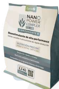
Power Complex B

Polvo soluble con aporte de N, P, K, Ca, S, B y Cu